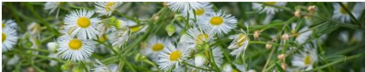
Foto Neophyt - Einjähriges Berufskraut

Sind Ihnen der Schutz und die Förderung der Biodiversität auf dem Gebiet der Gemeinde Hedingen wichtig? Wenn ja, nutzen Sie die Gelegenheit und nehmen Sie am nächsten Anlass der Naturschutzkommission teil!